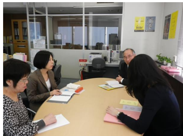
—直接的支援実地研修のようす—